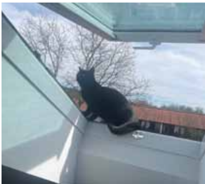
Mummel/Brumbär hat das Hoteldach erobert und sorgt dafür, dass das Dach Taubenfrei bleibt!