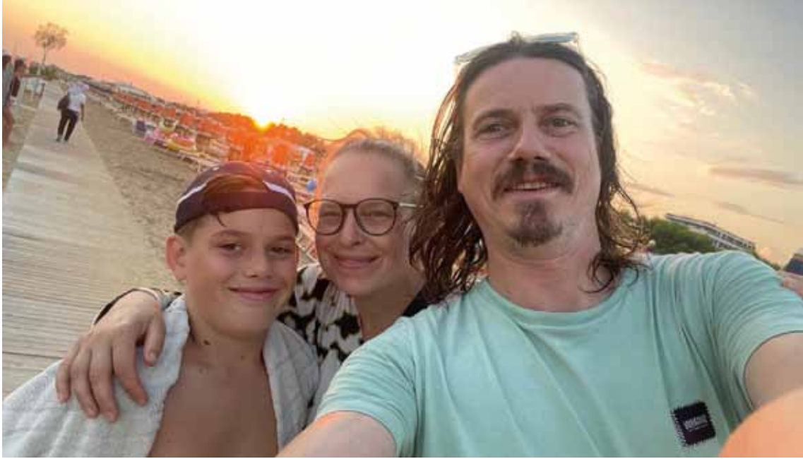
... beim Kurztrip in Bibione am Strand.