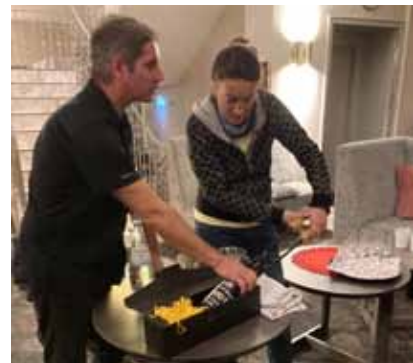
Wer in Porto ist, kann meine Schwester besuchen www.myvivatours.com

HOTEL QUELLENHOF KUR - THERME - WELLNESS BAD BIRNBACH